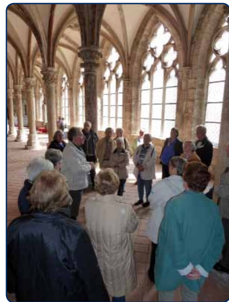
Die Reisegruppe besichtigt das Klostermuseum Walkenried.