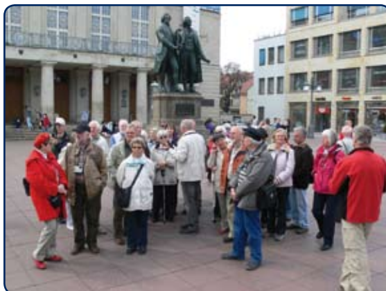
In Weimar wandelte die Reisegruppe auch auf den Spuren von Goethe und Schiller.